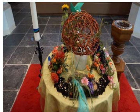
De symbolische bloemschikking