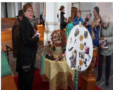
De collage van de kindernevendienst

De kinderen van de kindernevendienst hadden een boom gemaakt met groene collages over de natuur. Er was een prachtige symbolische bloemschikking, waarin de thema's schepping, natuur en duurzaamheid vanuit het verleden, het heden en de toekomst in beeld waren gebracht en in de vorm van een lint spannend en tegelijk hoopvol met elkaar waren verbonden.